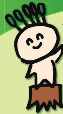
イメージキャラクター マモルくん